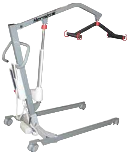
Vier-Punkt-Transportbügel mit Schutzüberzug